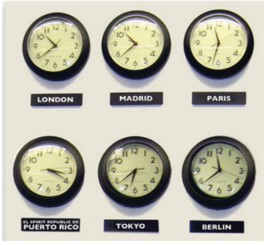
صورة رقم ١٤ (التوقيت العالمي)